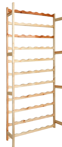
Ściana półek z wycięciem na korpus butelki